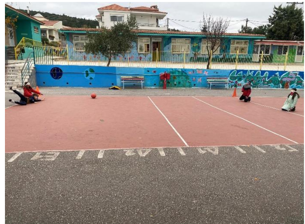
Βιωματική προσέγγιση του παραολυμπιακού αθλήματος Γκολ Μπολ για άτομα με απώλεια όρασης ή περιορισμένη όραση.