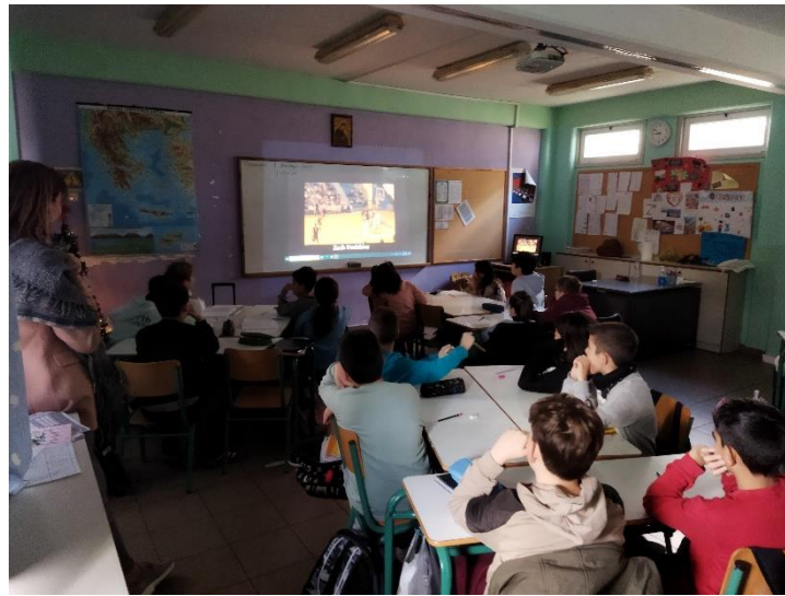
Παρακολούθηση βίντεο Παραολυμπιακών Αγωνισμάτων.